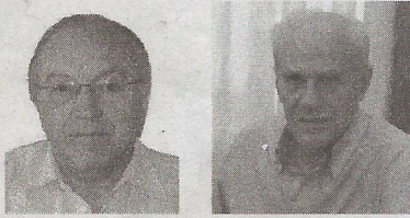
* Από τους Φάνη Γέμτος και Κώστα Γκούμα

Και αν έλθουμε για λίγο στη θέση ενός μέσου παραγωγού-χρήστη νερού για άρδευση στη Θεσσαλία (όπου το 70% και πλέον χρησιμοποιεί υπόγεια νερά λόγω της έλλειψης έργων ταμίευσης επιφανειακού νερού), ο οποίος κάλλιστα θα μπορούσε να θέσει το ερώτημα: «Εσείς, διαχρονικά, ως Πολιτεία, ως Κράτος, ως Διοίκηση, ταγμένοι (υποτίθεται) στην επίλυση των προβλημάτων μας, έχετε άραγε κά-