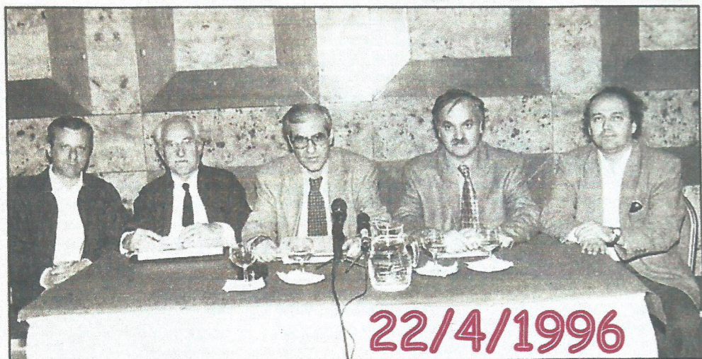
Απο την χθεσινή συνέντευξη τύπου στο Ξενοδοχείο Διβάνη

Στην ενημέρωση και στην ευαισθητοποίηση του αγροτικού κόσμου σε θέματα εκμετάλλευσης των υπόγειων νερών, που δεν είναι ανεξάντλητα, αναμένεται να συμβάλει το 2ο πανελλήνιο συνέδριο του ΓΕΩΤΕΕ Κεντρικής Ελλάδας και του γεωπονικού συλλόγου Λάρισας, που αρχίζει αύριο το απόγευμα στο συνεδριακό κέντρο του ΤΕΙ παρούσα του υπουργού Γεωργίας κ. Στεφ. Τζουμάκα.