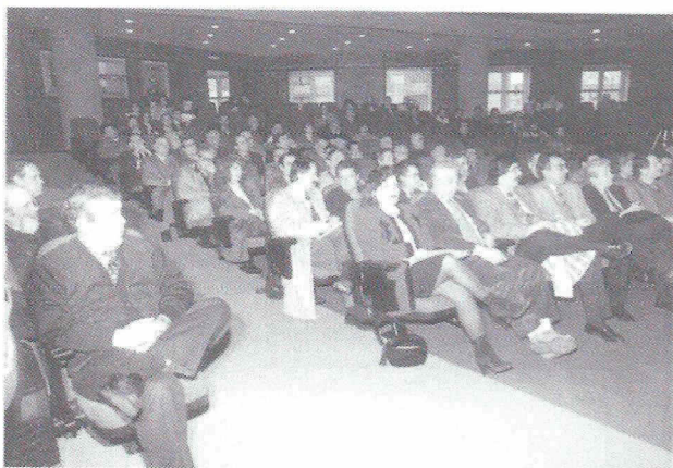
Αποψη της αίθουσας

Αποφασίσθηκε να συγκροτηθεί αντιπροσωπεία