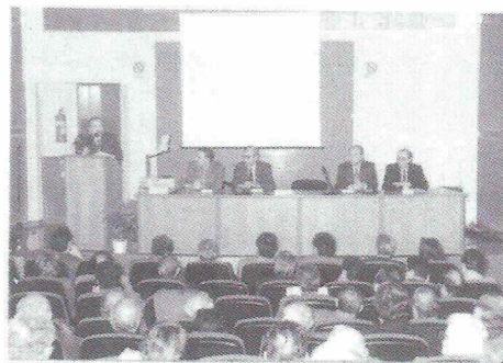
Το προεδρείο της ημερίδας