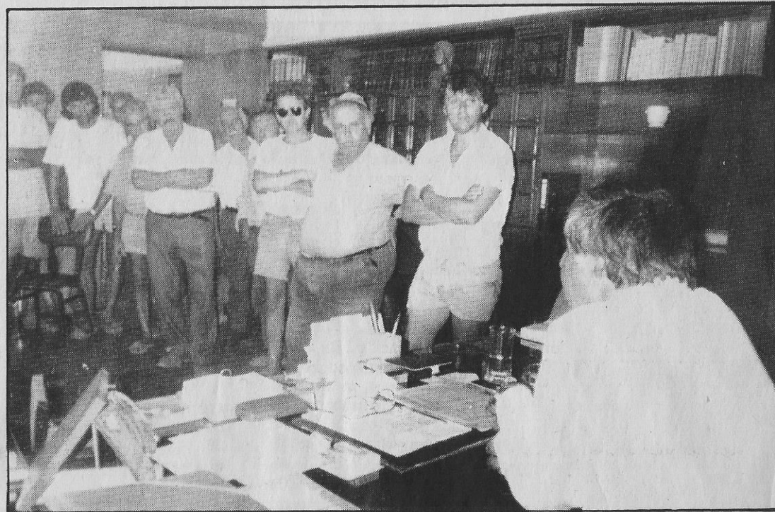
Την αγωνία τους δεν έκρυψαν χθες κατά την επίσκεψή τους στο νομάρχη οι αγρότες. Δεν είναι δυνατόν έλεγαν ο νομός Καρδίτσας να ανήκει σε άλλο κράτος!

Επ' αυτού ο νομάρχης ενημέρωσε τους αγρότες, ότι όλες οι ενέργειες από πλευράς του έγιναν και γίνονται,