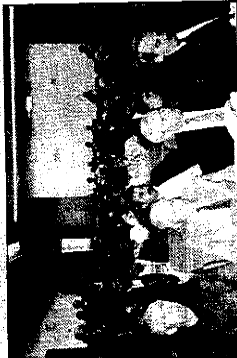
Την άποψη ότι ο συνταξιοδότης δεν θα πρέπει να πάρει μέρος σε επαναληπτικές εκλογές για την κάλυψη της κενής έδρας που δημιουργείται στην Β' εκλογική περιφέρεια της Αθήνας μετά την εκπτώση από το βουλευτικό αξίωμα του κ. Δημ. Τσοβόλα, εξέφρασε χθες κατά την διάρκεια πολιτικής συγκέντρωσης