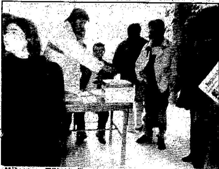
Μέλος του ΣΥΝ ψηφίζει για την μετατροπή της παράταξης σε ενιαίο κόμμα