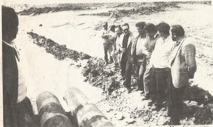
Το νερό διοχετεύεται στον ταμιευτήρα παρουσία του Νομάρχη και άλλων παραγόντων